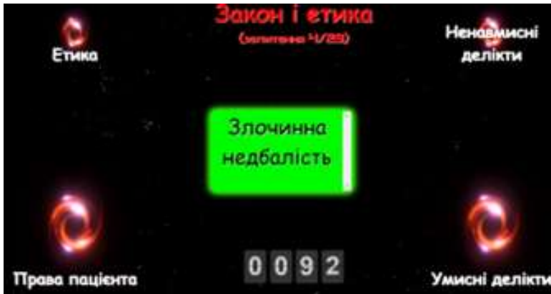
Рис. 3. Завдання vortex «Закон і етика»

(Vortex: Create your own sorting games. ClassTools.net: Free Tools for Classroom Teachers and School Students. URL: https://www.classools.net/vortex/7-lpFel (дата звернення: 06.12.2024)).