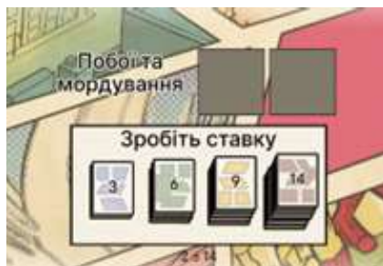
Рис. 2. Завдання «Виграй чи програй»

(Рабцун О. Цивільне право України. Wordwall. URL: https://wordwall.net/uk/resource/83390935/цивільне-право-україни (дата звернення: 06.12.2024)).